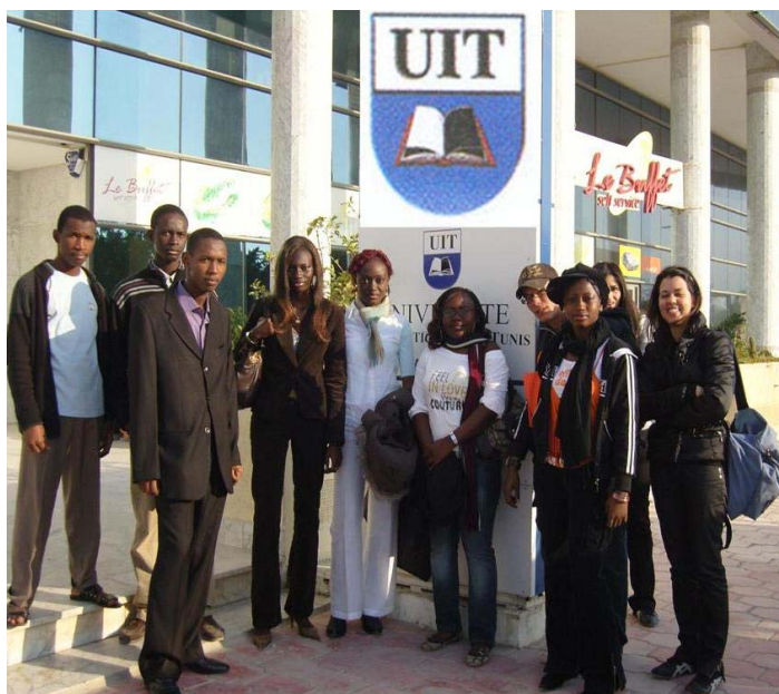
Des étudiants de l'UIT