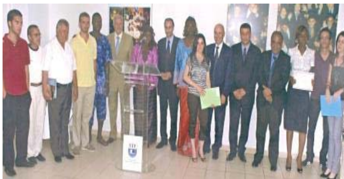
Cérémonie de remise des diplômes de l'UIT pour l'année 2007/2008